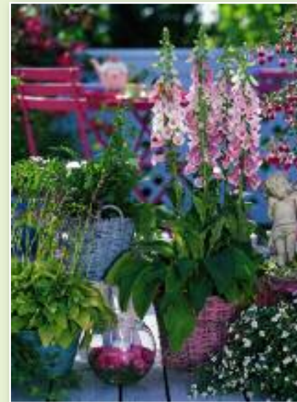
Landhaus-Stil: Mehrjährige Stauden wie Fingerhut und Funkie werden in große Körbe gestellt und mit Balkonblumen kombiniert. Hinzu kommen verspielte, aber edle Details.