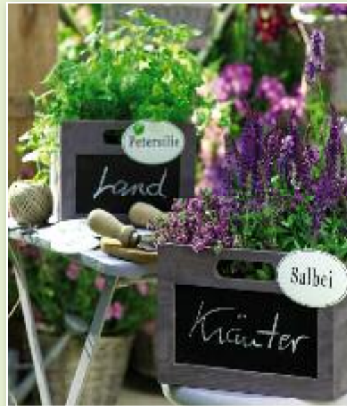
Anstelle der Bambusrollos wird eine Matte aus Heidekraut oder Rinde vor die Brüstung gestellt. In Holzkisten können Sie einen kleinen Kräutergarten mit Duft- und Küchenkräutern zusammenstellen.