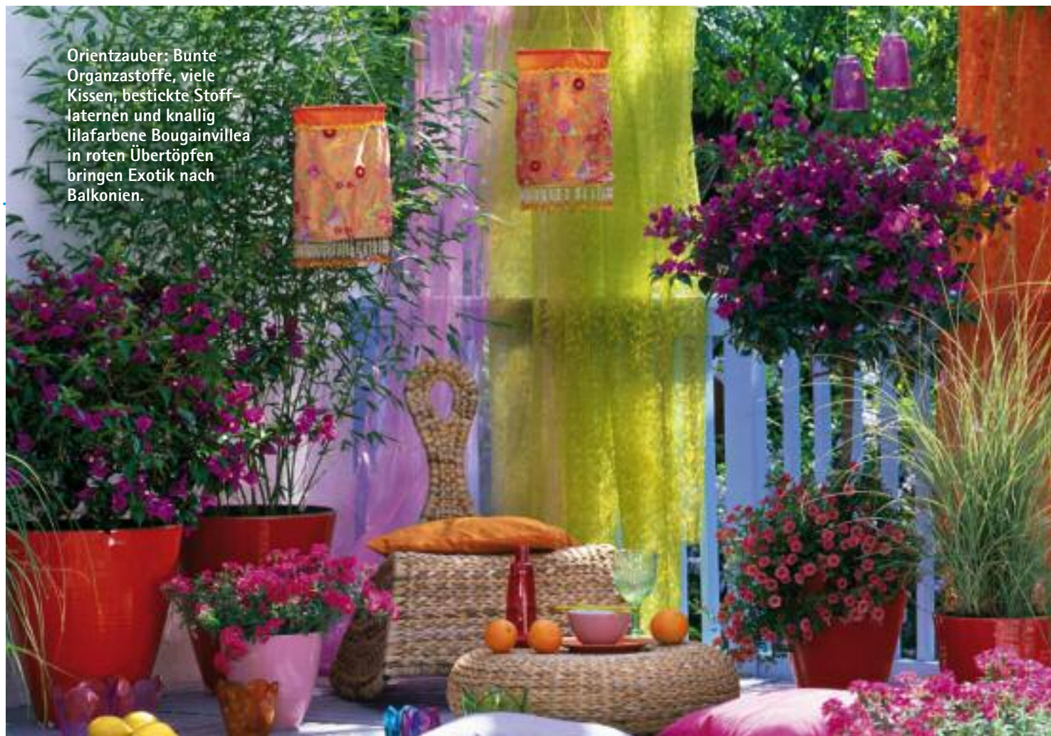
Orientzauber: Bunte Organzastoffe, viele Kissen, bestickte Stofflaternen und knallig lilafarbene Bougainvillea in roten Übertöpfen bringen Exotik nach Balkonien.