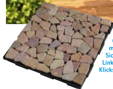
Oben: Die Holzplanken werden auf Querlatten montiert. Passend zum natürlichen Look: Sichtschutz „California“ aus Schilf. Links: Die Mosaik-Steinfliesen sind dank des Klicksystems leicht verlegt.