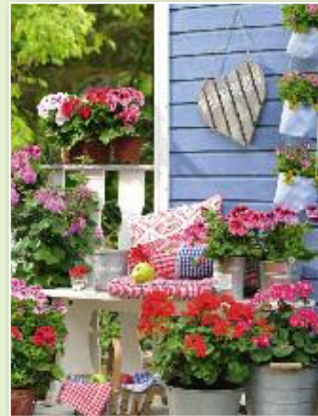
Im Handumdrehen wird's ein rustikaler Bauernbalkon: mit Pelargonien, weiß lackierter Holzbank, Kissen in blau-rottem Karomuster und einem großen Holz-Herz.