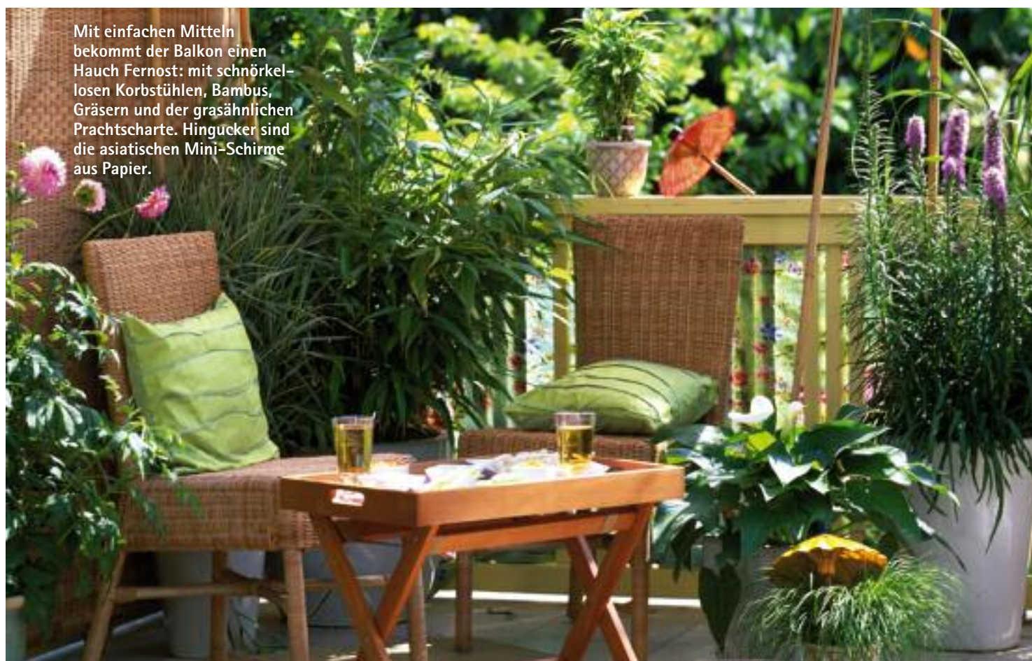
Mit einfachen Mitteln bekommt der Balkon einen Hauch Fernost: mit schnörkellosen Korbstühlen, Bambus, Gräsern und der grasähnlichen Prachtscharte. Hingucker sind die asiatischen Mini-Schirme aus Papier.

ILLUSTRATIONEN: HORST GEBHARDT (3) NACH ENTWÜRFE VON ULRIKE PÜRSCHHEL